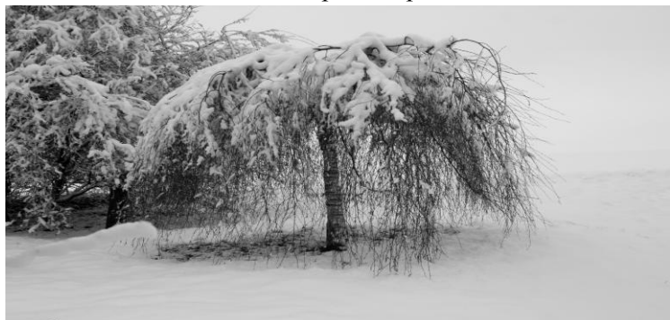
21. 3. 2007- první jarní den