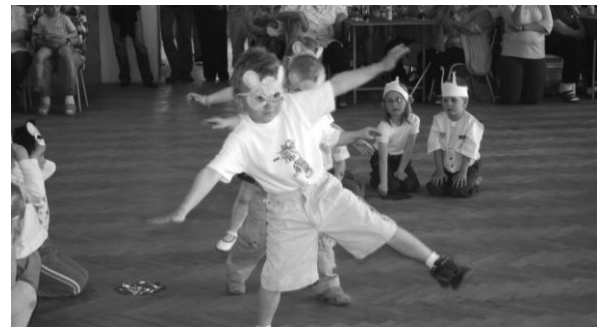
Dva obrázky dokumentující atmosféru a výkony účinkujících.